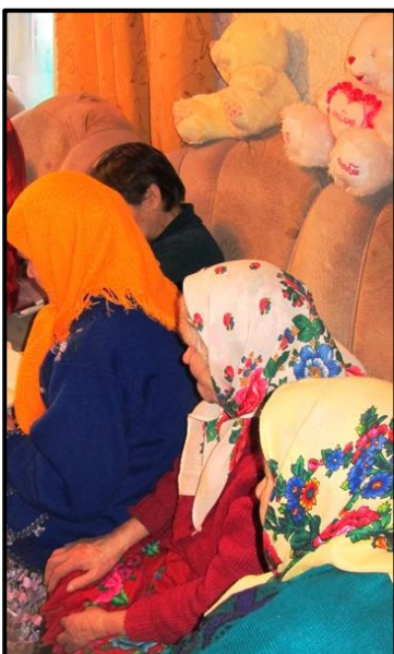
Hartaushetki Birskissä seurakuntalaisen kotona.

Juuri talouteen ja hallintoon liittyvät kysymykset ovat monille tšekäläisille seurakunnille suuri haaste. Pyrimme tukemaan seurakuntia näissä asioissa järjestämällä erilaisia koulutuksia ja vierailuja alueille. Yhteydenpito paikallisten kumppaneidemme kanssa on merkittävää myös hengellisessä mielessä. Pienet ja köyhät seurakunnat taistelevat olemassaolostaan. Kirkoissa on vain vähän työntekijöitä ja paljon työtä. Hengellinen ja henkinen ja toki myös taloudellinen tuki ovat elintärkeitä. Suomalais-ugrialaisten heimojen parissa tehtävä työ ja seurakuntien tukeminen ovat SLS:n ydintyötä täällä. Koulutukset ja kumppanimme työn ja kapasiteetin vahvistaminen jatkuvat.