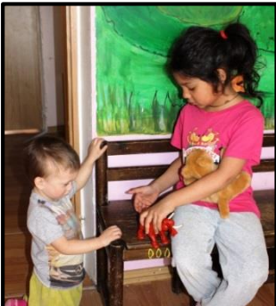
Dikonissa lapset osaavat ottaa toisensa huomioon.